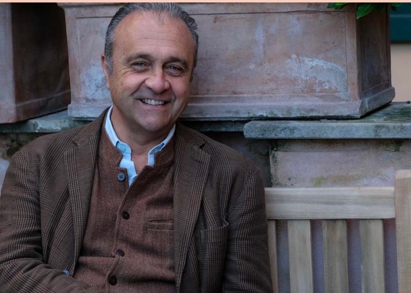
Nicolò Bassetti – autore e regista di «Nel Mio Nome»