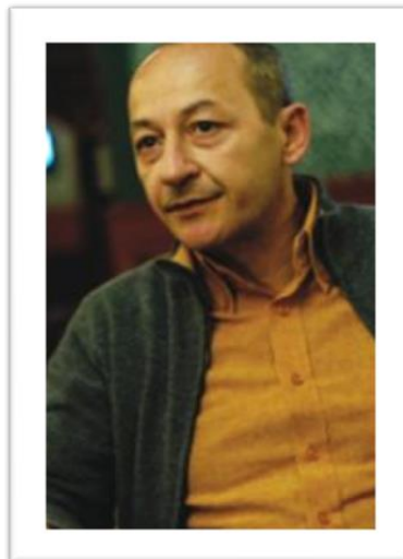
Con la partecipazione amichevole di SALVATORE CANTALUPO - MASSIMILIANO (GOMORRA IL FILM)