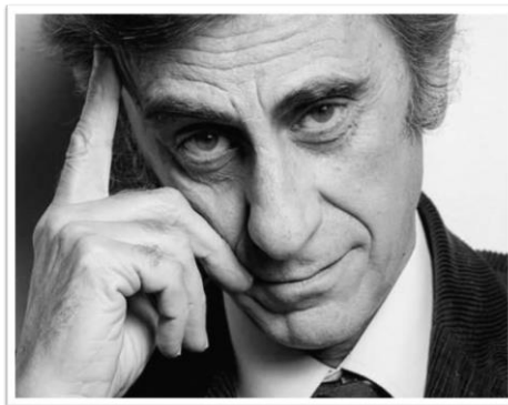
Con la partecipazione amichevole di PIETRO DE SILVA- GIULIO ("La vita è bella", "Non ti muovere")