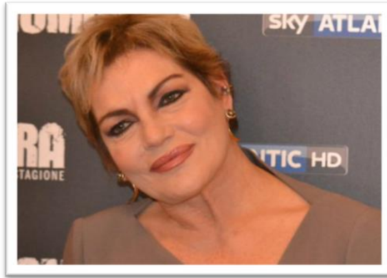
Con la partecipazione straordinaria di CRISTINA DONADIO – ROBERTA (Scianel in "Gomorra 2 la serie")