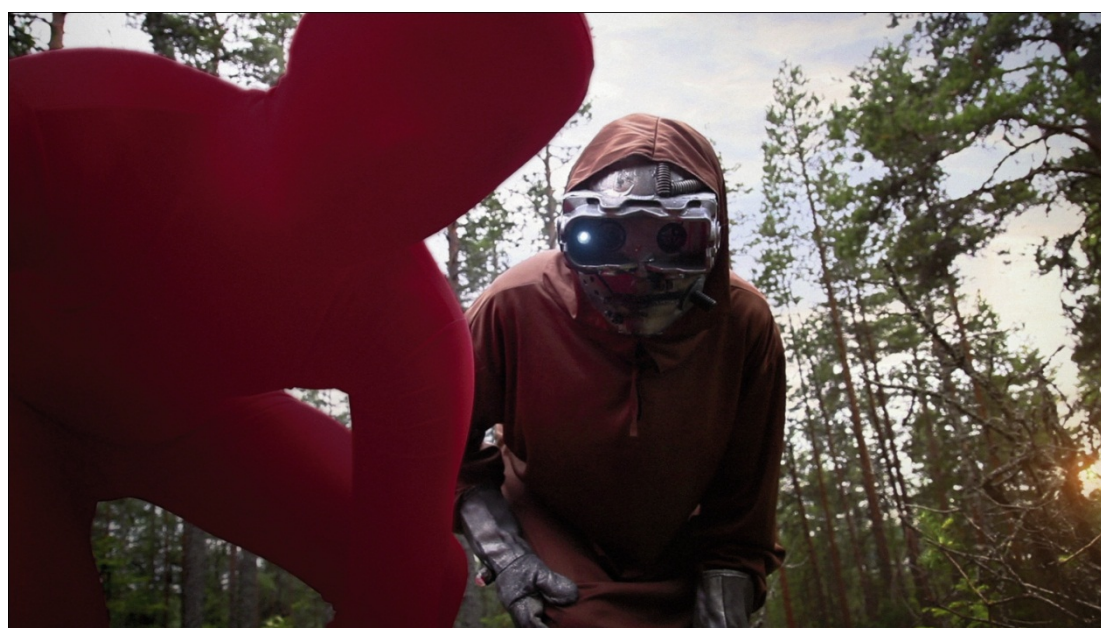
I RACCONTI DELL'ORSO un film di Samuele Sestieri e Olmo Amato